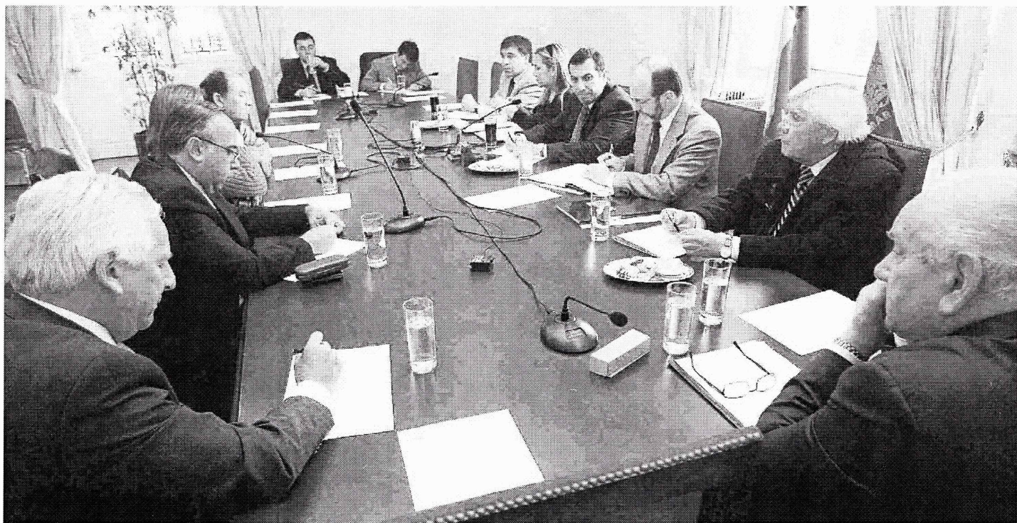
La comisión investigadora votó ayer el informe final que consigna serios reparos políticos a las autoridades de Educación del gobierno anterior.