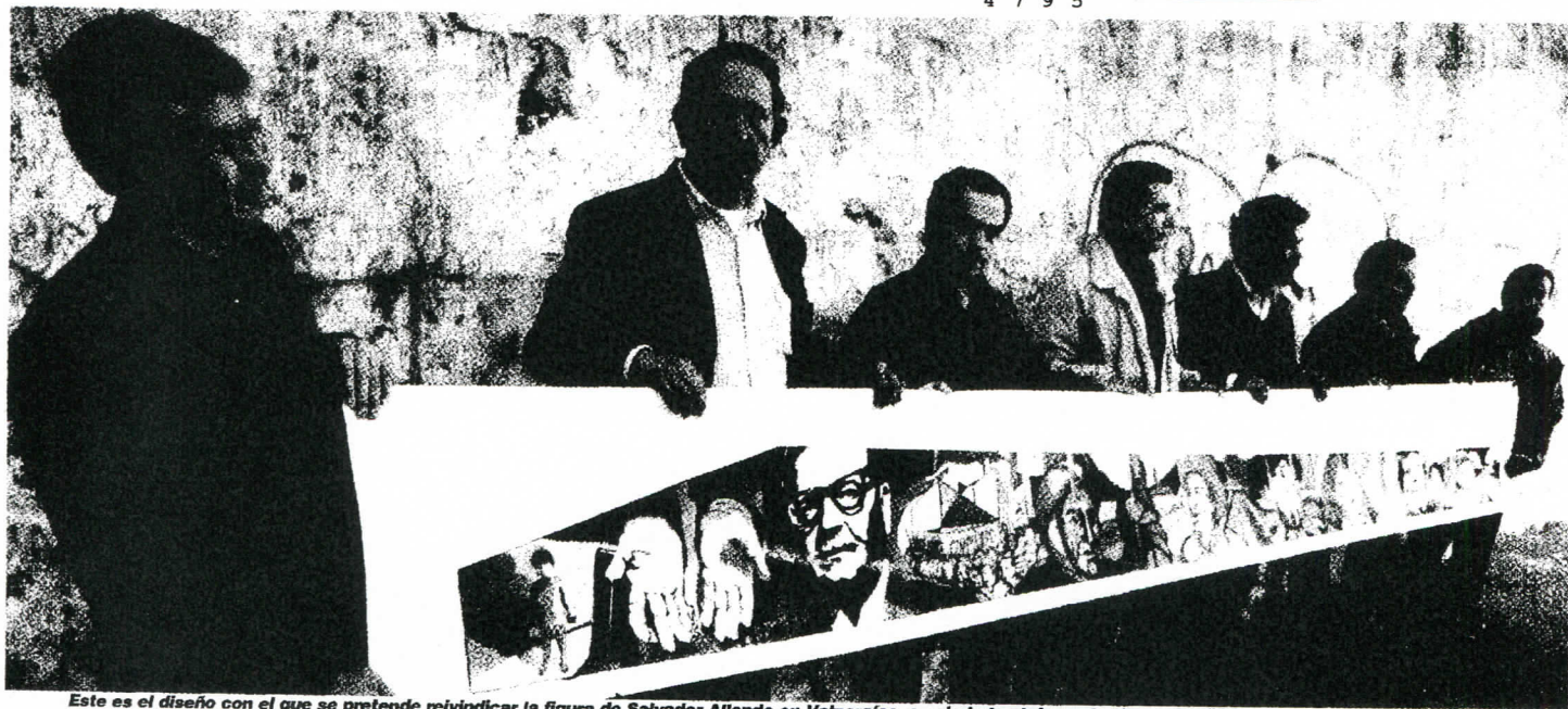
Este es el diseño con el que se pretende reivindicar la figura de Salvador Allende en Valparaíso, su ciudad natal, mostrado por los "GAP" en el futuro emplazamiento.

Iniciativa de ex GAP con permiso municipal: