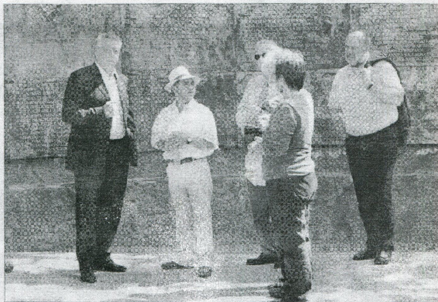
El secretario de Estado alemán no sólo se dedicó a hablar del mercado laboral, también se dio tiempo para visitar Villa Grimaldi.

En Chile, desde hace unos años se ha instalado en la agenda el tema de la responsabilidad social y se está incorporando en las empresas, pero según ha dicho la autoridad aún hay mucho espacio para que las em-