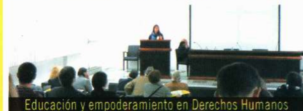
Educación y empoderamiento en Derechos Humanos