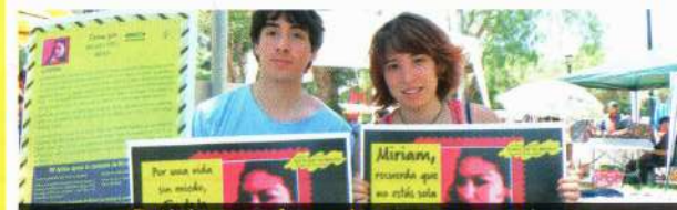
Peticiones a favor de personas en riesgo