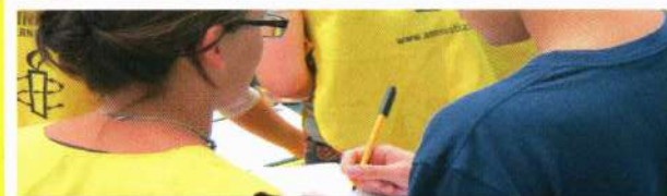
Recolección de firmas y otras actividades en la calle

Contribuimos a poner fin a los abusos contra los Derechos Humanos movilizand o a la opinión pública para que presione a los gobiernos, grupos políticos armados, empresas y organismos intergubernamentales, mediante actividades tales como: