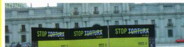
Presión a los gobiernos y otros actores no estatales