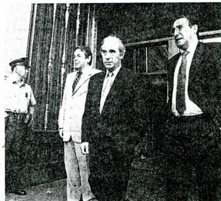
Los senadores concertacionistas expresaron al general las inquietudes despertadas por el informe de la institución policial.

El general dijo a los tres senadores —según dijeron éstos— que "no se ha ocultado ni se ocultará información" y que a él le interesa superar este problema, dejando el camino despejado a quien sea su sucesor en el mando. ■