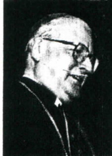
El Vaticano envió a la Cancillería británica la carta "a petición del actual gobierno chileno, compuesto de una coalición demócratacristiana y socialista". A la izquierda, el cardenal Angelo Sodano, y a la derecha el subsecretario de Relaciones Exteriores Mariano Fernández.