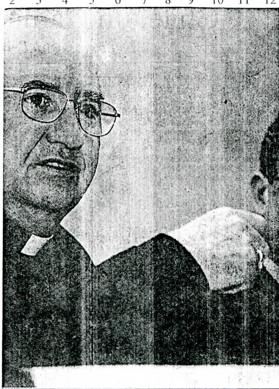
Monseñor Errázuriz expuso que reconocer el dolor de los familiares de los detenidos desaparecidos y crear las condiciones para la entrega de información en forma confidencial son aspectos fundamentales para alcanzar la verdadera reconciliación nacional.