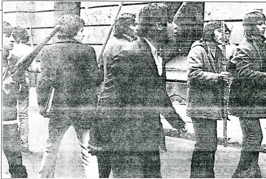
En el pasado hubo "la voluntad, probablemente bien intencionada, de imponerle al país sucesivos ordenamientos globales, a pesar de no contar con el respaldo estable y mayoritario de la ciudadanía; de la exacerbación del antagonismo, la descalificación y la prepotencia; entre otros muchos factores externos e internos".

sino la dignidad de la persona. En los peores tiempos las razas discriminadas no decían "han atropellado nuestros derechos", sino "¿cómo nos han humillado!" Por eso la solución que han tratado de dar a sus problemas pasados no se queda en la búsqueda de la verdad y de la justicia. Para avanzar hacia la reconciliación han tenido una percepción profundamente humana. Ni siquiera le exigen al acusado que se arrepienta antes de darle, individualmente, la amnistía. No quieren forzarlo. Basta con que sea sincero y diga toda la verdad. Por el puente de la sinceridad y de la verdad pasará normalmente, como un fruto maduro, el arrepentimiento y el deseo de reconciliación. Para lograr la reconciliación, que incluye el recomponer las buenas relaciones y el ánimo de quienes estaban enemistados entre sí, no bastan los propósitos de la voluntad. Sudáfrica percibió que se necesita una gran labor de sanación. Para ello también abrió muchos lugares de atención a los ciudadanos que quedaron traumatizados, de una y otra parte, por la violencia del pasado. En verdad, la tarea de reconciliar incluye una componente importante que se refiere a la salud del alma.