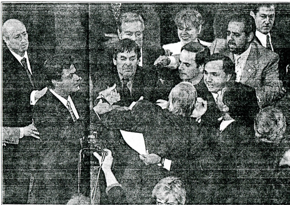
“Si queremos buscar lecciones del pasado, hemos de reconocer, antes que todo, que la inclinación al entendimiento no ocupa el primer lugar en el catálogo de las virtudes que nos distinguen”.

El derecho de quienes han sufrido a exigir que se practique justicia merece todo el respeto de la sociedad. Su causa es justa. Las violaciones a los derechos humanos merecen un castigo expiatorio y medicinal. Por eso el Comité Permanente de la