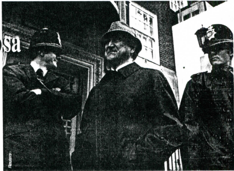
El parlamentario de derecha estuvo en Londres para demostrar su apoyo al senador vitalicio, y de paso realizar un lobby político.

señor de Amnesty y nos decía: “Muy bien todo lo que hemos oído, pero el régimen de Pinochet tortura”. Nosotros le respondíamos: “Mire señor, en este mismo instante lo invitamos a que vaya a Chile el día que quiera, puede ir donde quiera y ver lo quiera”. El señor se sentaba. Nunca más supimos de él. Estoy convencido de que Amnesty es un organismo de fachada de la izquierda, que lo único que quería era montar esta campaña. No tenía