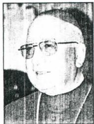
El cardenal chileno Jorge Medina

"pinoche-tista confeso" y criticó la intervención del Vaticano en favor del senador vitalicio. En su argumentación, el