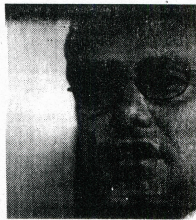
Marco Antonio Pinochet.

En marzo de 1987, EE.UU. pidió a la dictadura