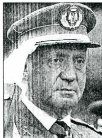
Rey Juan Carlos.

Pablo II recibe varias balas disparadas por el turco Mehmet Ali Agca, quien atacó al pontífice en medio de una multitud reunida en la plaza San Pedro del Vaticano.