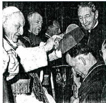
El Papa Juan XXIII lo inviste como cardenal, el 19 de marzo de 1962.

Había pagado el precio de sus posiciones en la vida social y política del país. "Pero se repuso volviendo a su primitiva vocación salesiana: atender a la gente, en especial a los jóvenes y niños. Los fines de semana con los pequeños de la aldea SOS en Punta de Tralca eran su tónico".