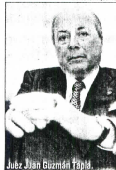
Juez Juan Guzmán Tapia.