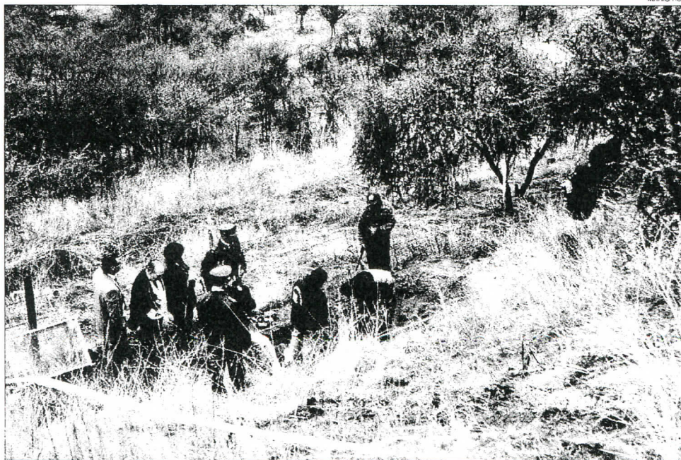
En la Cuesta Barriga sólo se encontraron pequeños restos óseos de dirigentes del PC desaparecidos en 1976. Para el gobierno, el hecho dejó en evidencia la práctica de exhumaciones ilegales.