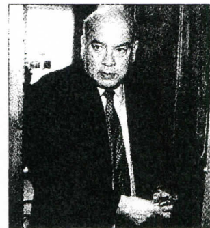
El ministro del Interior, José Miguel Insulza.

Este sentido último de la iniciativa —que conjuga las demandas de verdad y de agilizar los procesos judiciales— haría viable investigar el tema de las remociones, pese a que implicaría un desfile de muchos militares activos en tribunales. Si hasta ahora la