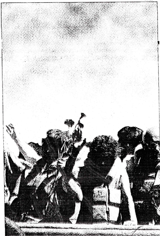
Familiares de detenidos desaparecidos arrojando flores al mar (arriba). La actuación del juez Juan Guzmán (arriba derecha) ha podido establecer el número de las víctimas lanzadas al océano, no su identidad.

Las máquinas partían cada vez desde el aeródromo de Tobalaba en la comuna de La Reina, donde durante esos años funcionó el Comando de Aviación del Ejército. La tripulación la conformaban un piloto, un copiloto, y un mecánico. El vuelo se iniciaba con destino a Peldehue, en Colina. Allí, en terrenos militares, descendían y eran esperados normalmente por dos o tres