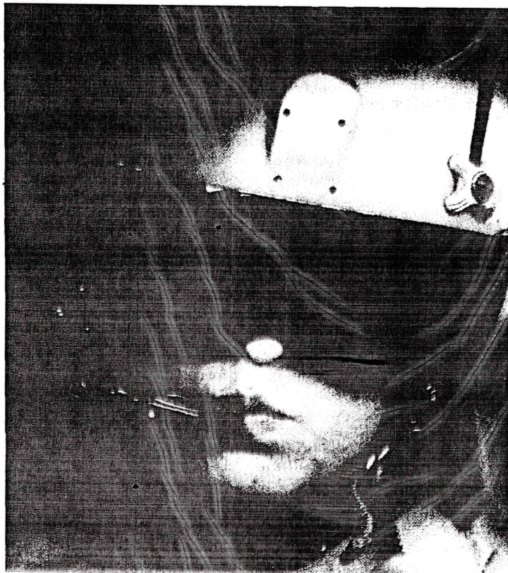
Jorge Escalante REDACCIÓN DE LA NACIÓN

UNA EXHAUSTIVA Y LARGA INVESTIGACIÓN DEL JUEZ JUAN GUZMÁN Y SU EQUIPO DE DETECTIVES DEL DEPARTAMENTO V LOGRÓ DEVELAR EL MEJOR SECRETO GUARDADO POR LA DINA: el destino de sus desaparecidos en la Región Metropolitana. La operación sistemática fue realizada por los pilotos y mecánicos de los helicópteros Puma del Comando de Aviación del Ejército entre los años 1974 y 1978.