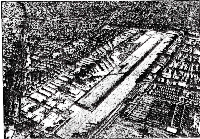
La mayor parte de los desaparecidos que salían de Villa Grimaldi con la marca "Puerto Montt" partían del aeródromo de Tobalaba.