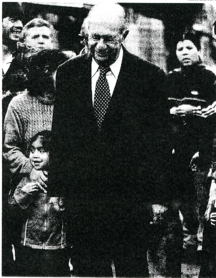
EL PRESIDENTE LAGOS ha manifestado su satisfacción con la agilización de las investigaciones judiciales en materia de derechos humanos, por lo que no está convencido de que sea necesario hacer cambios legales para bajar penas