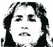
Gladys Marín, secretaria general del PC

"Mientras no se termine con la red oculta de apoyo a los que cometieron crímenes, que son responsables directos, y al principal, al número 1, a Pinochet, mientras eso no se termine, realmente las palabras son palabras...".