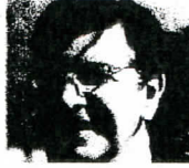
Joaquín Lavín, alcalde de Santiago

"Me parecen muy bien (los dichos de Cheyre), porque a 30 años del 11 de septiembre del '73, éste debería ser un año para cicatrizar heridas, para reconciliarnos y para que el país, como dijo Cheyre, tenga claro que estas cosas nunca más van a poder pasar".