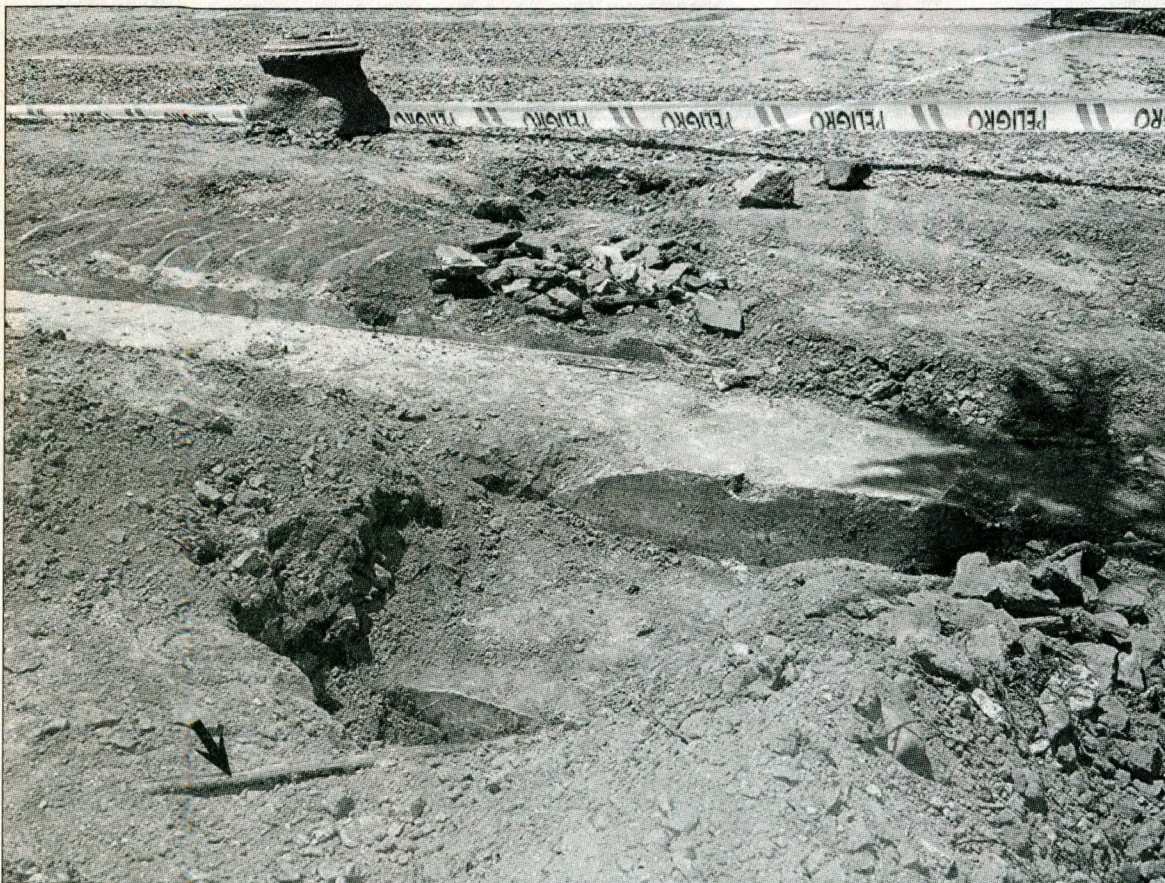
En la foto se aprecia la Cañería de riego instalada por sobre los peldaños de la escalera original al construirse el parque. Todo fue después sepultado.