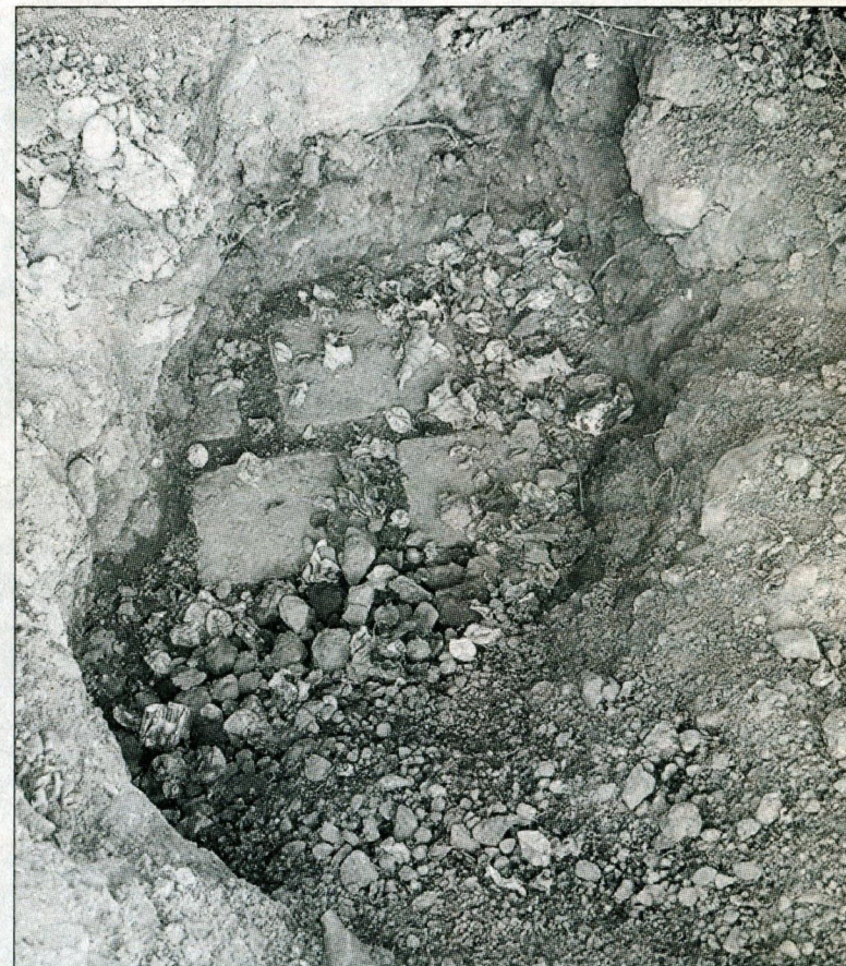
Un sendero de adoquines original aparece bajo unos cincuenta centímetros de tierra.

SEPULTADOS CUANDO EN 1994 SE CONSTRUYÓ EL PARQUE POR LA PAZ