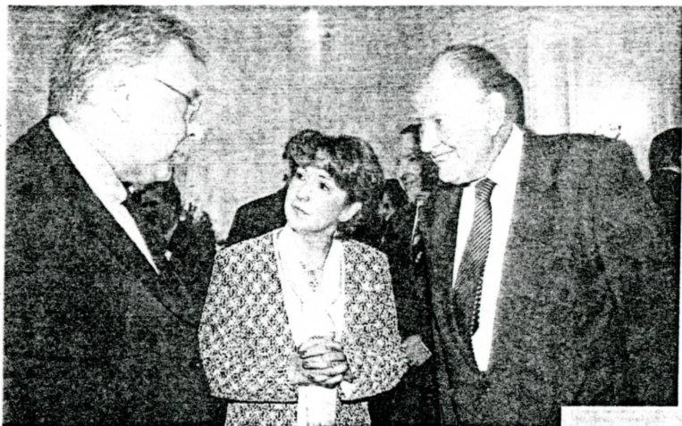
Los ex mandatarios Felipe González y Patricio Aylwin junto a Soledad Alvear, ministra de Relaciones Exteriores.