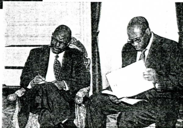
Penuell Maduna, ministro de Justicia de la República de Sudáfrica, y Bulelani Ngcuka.