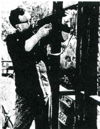
Salvador Allende: "Si a Chile se le cierran caminos, no quedaría más alternativa que la insurgencia armada ".