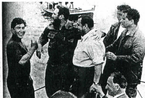
Fidel Castro en Chile ofrecía apoyo armado de «millones de cubanos» en caso de « agresión del imperialismo ».

● Miguel Enríquez: "Siempre hemos afirmado que la conquista del poder por los trabajadores sólo será posible mediante la lucha armada ". (Octubre de 1970).