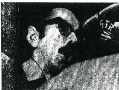
Carlos Altamirano: "Hay que destruir la vieja sociedad".