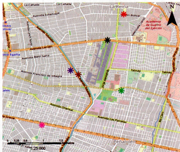
Mapa de ubicación, Región Metropolitana